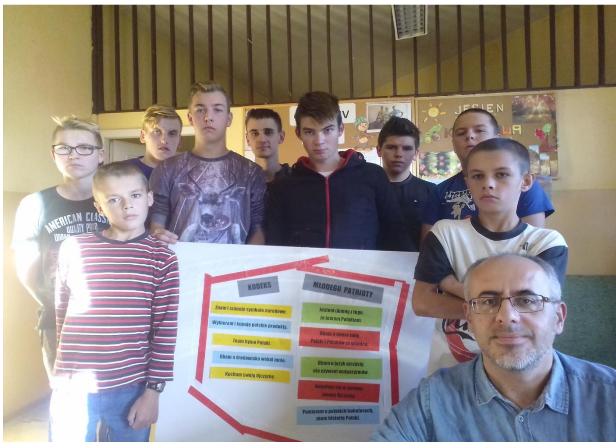
Opracowanie „Kodeksu młodego patrioty”.