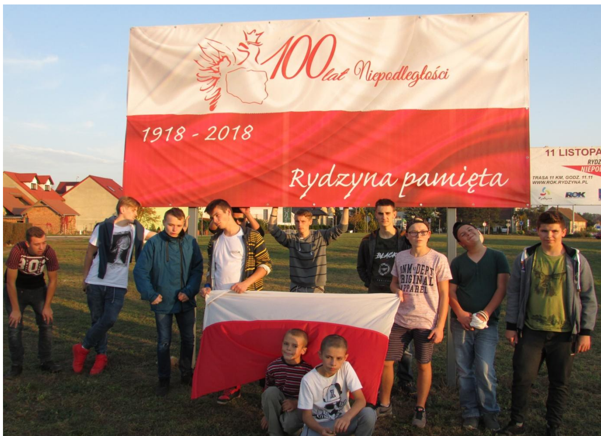
Rajd po Rydzynie z flagą narodową.