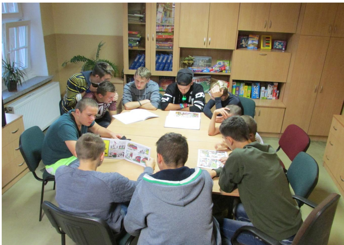
Wspólne czytanie fragmentów książek o tematyce historyczno – patriotycznej.