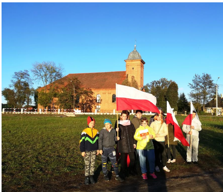
Ryc.1. Zwiad po Rydzynie.