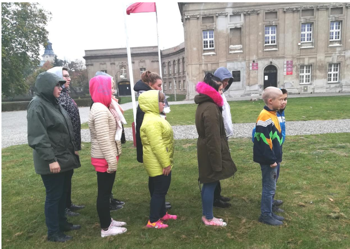
Ryc.4. Ćwiczenie musztry.