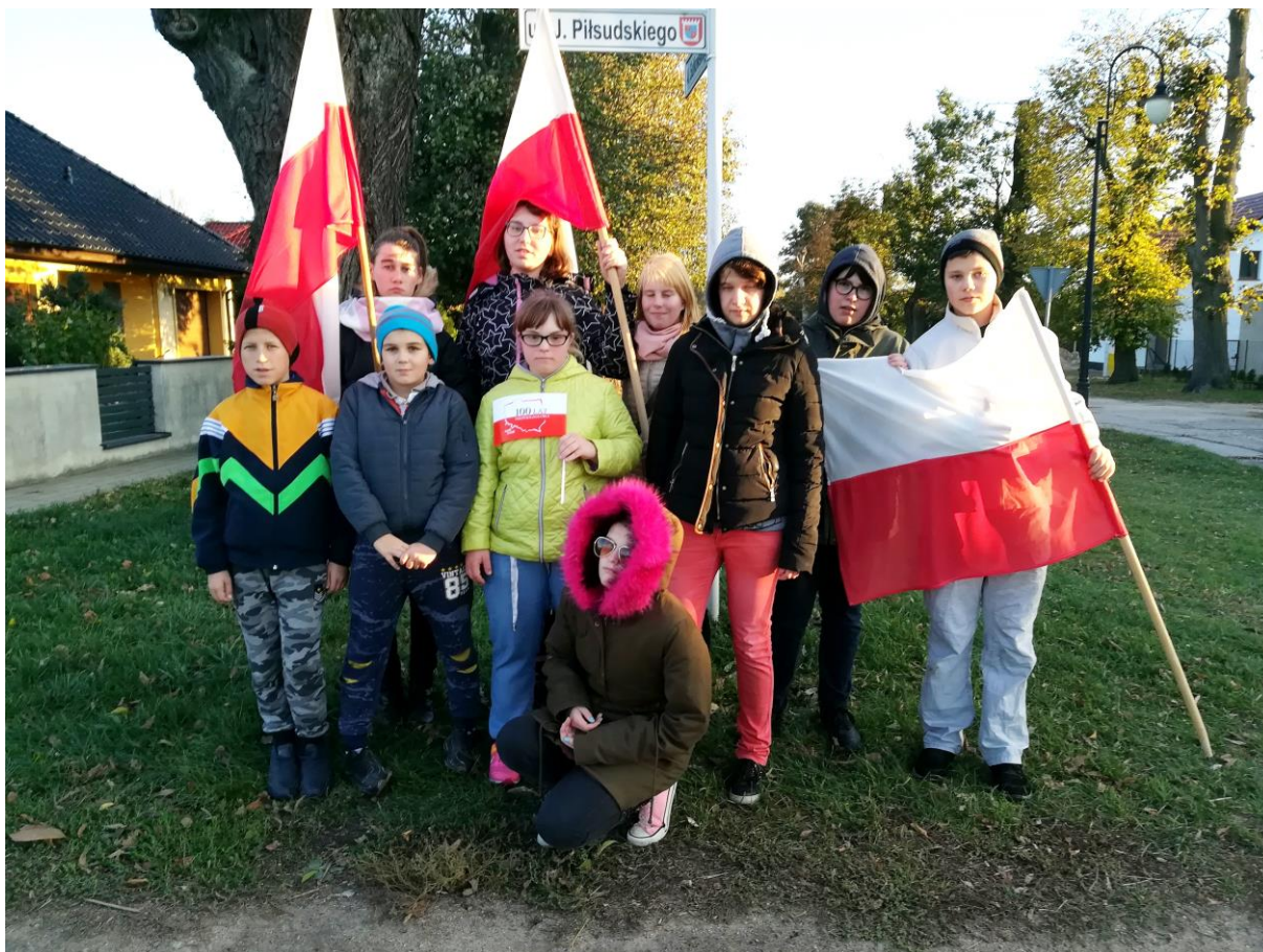
Ryc.2. Ulica J. Piłsudskiego w Rydzynie.